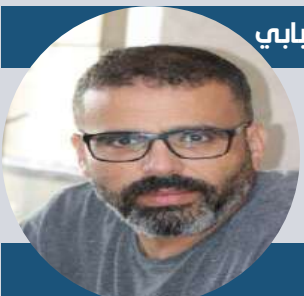
بقلم: د. حكيم قبابي

المنظمة "أخذت من تلك المحبرة ما يفيدها، وعجنته ببهارات عدائها الخاص للمغرب، وهو العداء الذي تعبر عنه بمسايرة، بل الترويج الإعلامي لمناهضي الوحدة الترابية المغربية، بما يضعها في موقع الخصم للمغرب بالتبعية، وينزع عنها صفة الحياد في تقويم الممارسة الحقوقية في المغرب"