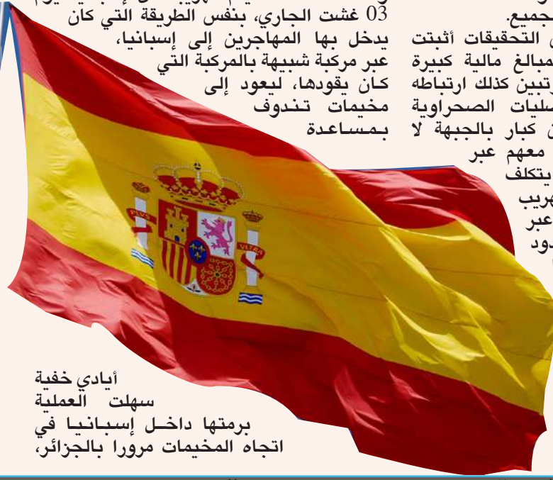
أيادي خفية سهلت العملية برمتها داخل إسبانيا في اتجاه المخيمات مرورا بالجزائر،

وعقد المحاكمة، ليتم تهريبه من إسبانيا يوم 03 غشت الجاري، بنفس الطريقة التي كان يدخل بها المهاجرين إلى إسبانيا، عبر مركبة شبيهة بالمركبة التي كان يقودها، ليعود إلى مخيمات تندوف بمساعدة